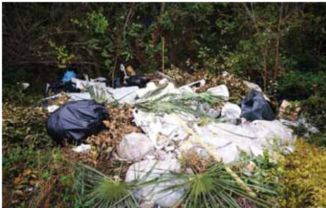
Rifiuti abbandonati sul Monte Rua

Per il prossimo anno la giornata dedicata a "Puliamo Torreglia" è stata fissata per il 10 di marzo , auspichiamo anche in questa occasione in una numerosa partecipazione della cittadinanza e dei vari gruppi che ringraziamo fin d'ora. Per cercare di limitare il problema dell'abbandono dei rifiuti l'Amministrazione sta valutando la possibilità di installare in alcuni punti critici del nostro territorio delle videocamere nella speranza che questo serva per riuscire a fermare tutte quelle persone che senza scrupolo e rispetto abbandonano i propri rifiuti nel nostro Paese.