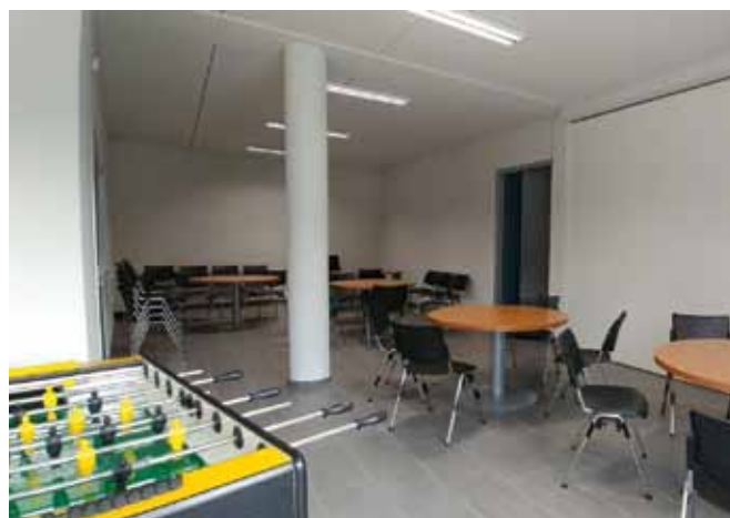
Sala Monte Piriò