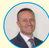
FILIPPO LEGNARO SINDACO