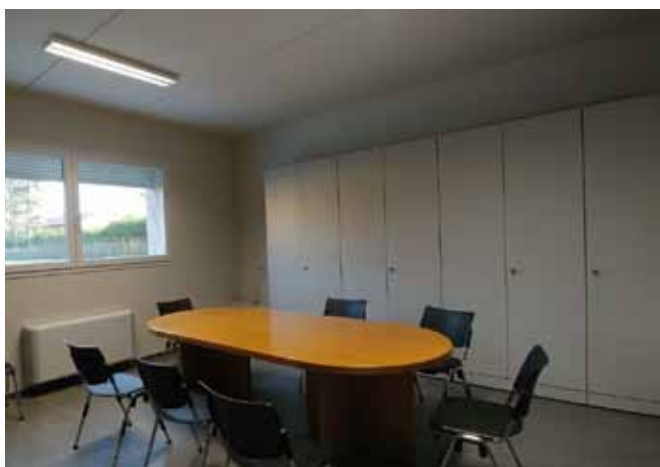
Sala Monte Lonzina