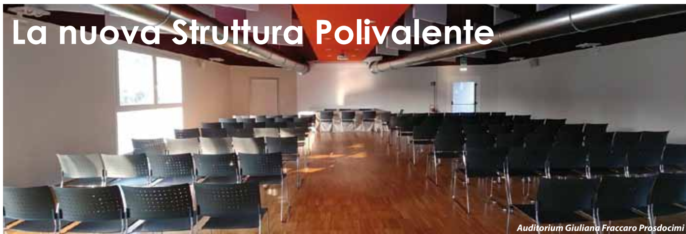
Auditorium Giuliana Fraccaro Pradocimi

Quanti cittadini si sono chiesti in questi mesi cosa fosse quell'edificio dalle strane forme, poco chiaro e non da tutti apprezzato nel suo aspetto architettonico. Difficile intuire cosa potesse racchiudere al suo interno e quale potesse essere la sua funzione. A volte veniva scambiato, durante i mesi della costruzione, per un complesso di appartamenti, altri lo consideravano un nuovo negozio, forse l'atteso supermercato. E comunque era proprio necessario realizzare un altro edificio con tutti quelli esistenti e poco utilizzati?